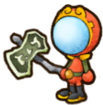
古代人の末裔「ヨナ」