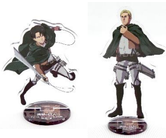
アクリルスタンド 各 1,700 円(税込)