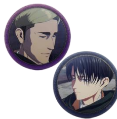
缶バッジセット 1,200 円(税込)