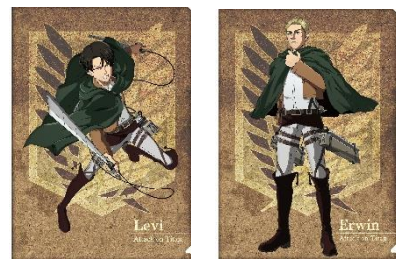
クリアファイルセット 800 円(税込)